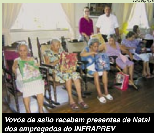
Vovós de asilo recebem presentes de Natal dos empregados do INFRAPREV

Além de doarem alimentos e roupas, cada grupo de três empregados adotaram uma das 13 idosas que são amparadas pela instituição. O presente foi um "kit" composto