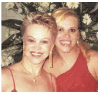
Album de Família