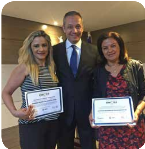
Certificado Empresa Cidadã